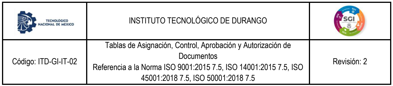
Tabla de Aprobación y Autorización de Documento(s)